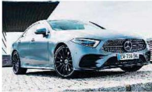
مرسيدس «سي إل إس 350»