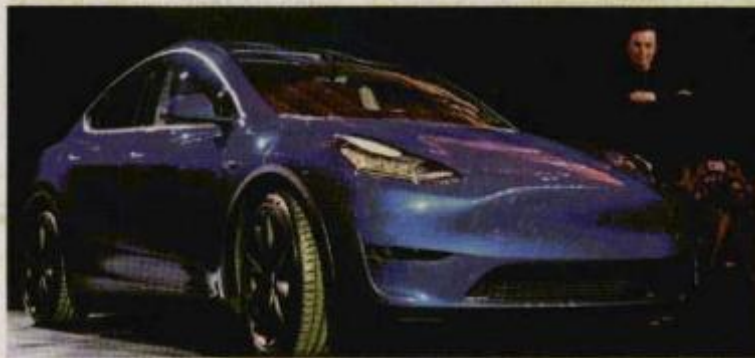
Elon Musk pitching in $10 million of his own money to buy shares.

"The growing worries around capital were a black cloud over the